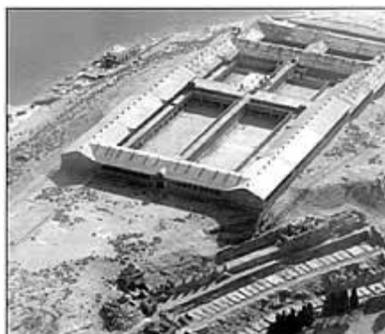
ΤΟ ΣΥΓΚΡΟΤΗΜΑ ΤΩΝ ΞΥΛΑΚΩΝ ΓΥΑΡΟΥ

Δεσπόζει μόνη της, ακατοίκητη, ήρεμη, ξεχασμένη από την πολυκοσμία, δίπλα σε άλλα κοσμοπολίτικα νησιά. Περνάμε δίπλα της, πολλές φορές, με κατεύθυνση σημαντικούς, για μας, προορισμούς, αδιαφορώντας για το ποιόν της. Η ιστορική Γυάρος αξίζει ένα τεράστιο διάλειμμα.