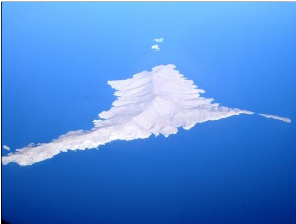
ΓΥΑΡΟΣ Ή ΓΙΟΥΡΑ (ΑΕΡΟΦΩΤΟΓΡΑΦΙΑ)

Δεσπόζει μόνη της, ακατοίκητη, ήρεμη, ξεχασμένη από την πολυκοσμία, δίπλα σε άλλα κοσμοπολίτικα νησιά. Περνάμε δίπλα της, πολλές φορές, με κατεύθυνση σημαντικούς, για μας, προορισμούς, αδιαφορώντας για το ποιόν της. Η ιστορική Γυάρος αξίζει ένα τεράστιο διάλειμμα.